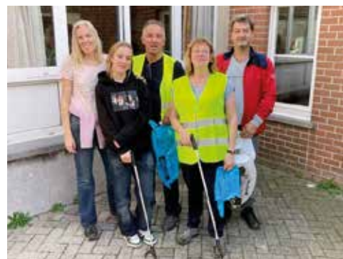
De N-VA steekt de handen uit de mouwen.

De gemeente en de milieuvadvisraad van Pepingen organiseren binnen het kader van het project Mooimakers een opruimactie van zwerfvuil. De gemeente nodigt alle jeugdverenigingen, buurtbeheerders en andere verenigingen uit om mee zwerfvuil te rapen. De N-VA koos dit jaar voor de wegen langsheen de deelgemeente Heikruis waar een massa vuil uit het autoraam wordt gegooid. Wilt u meer informatie over de campagne Mooimakers? Kijk dan eens op www.mooimakers.be