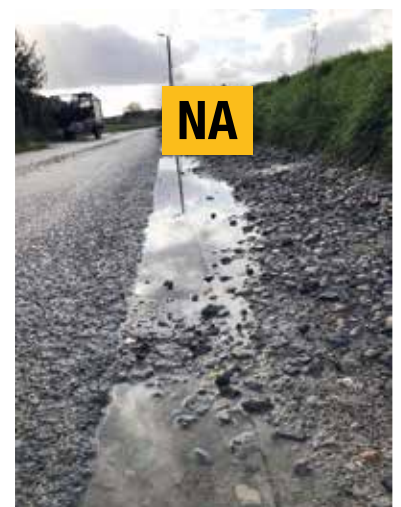
▲ Links de situatie na een ‘herstelling’ in juli. Rechts dezelfde plek in oktober.