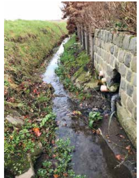
▲ Het Pepingse afvalwater stroomt rechtstreeks de natuur in.

raad gezet. We vragen dat de gemeente dringend werk maakt van een riolenplan op lange termijn. En ja, dat zal geld kosten. Maar het is onze verdomde plicht om een gezonde leefomgeving te creëren voor ons, onze kinderen en kleinkinderen.